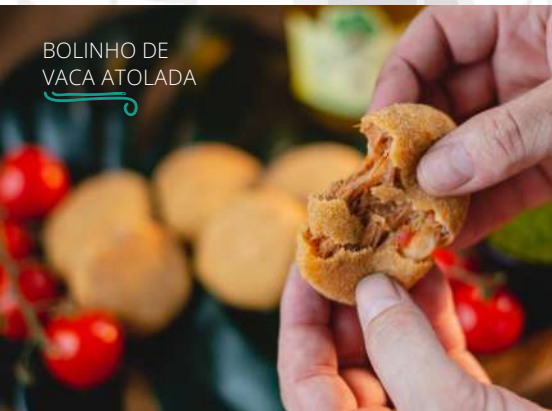
BOLINHO DE VACA ATOLADA

Deliciosos bolinhos de costela desfiada, com molho pomodoro e purê de aipim. Acompanha molho Bragança.