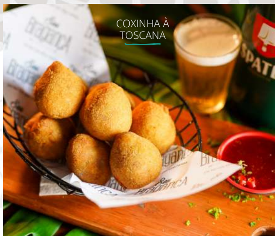
COXINHA À TOSCANA

Aquele clássico de final de tarde, croquetes de arroz. Nossa versão vem com uma massinha bem leve de batata inglesa, arroz, temperinhos e limão siciliano, recheado de queijo muçarela. Acompanha molho do chef.