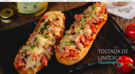
TOSTADA DE LINGUIÇA

Pão baguete estilo cervejinha tostado com ragú de linguiça pura de pernil temperado, queijo coalho gratinado, finalizado com tempero verde. Acompanha molho vinagrete e molho caseiro.