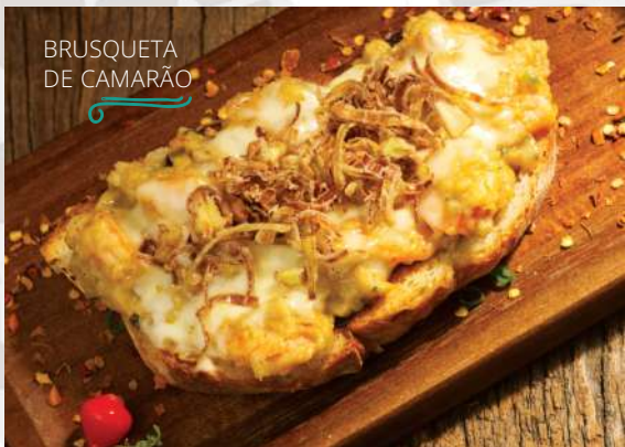
BRUSQUETA DE CAMARÃO

Pão bem macio de fermentação natural, camarões com um creme do próprio caldo, finalizado com queijo muçarela e alho poró crispy.