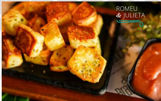
ROMEU & JULIETA

Aquela combinação perfeita de queijo e goiabada. Nossa versão vem em cubos de queijo coalho temperados com orégano e assados, acompanhando uma geleia de goiaba cremosa.