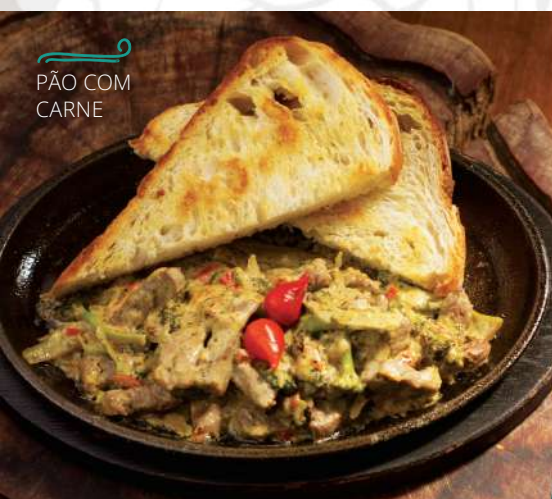
PÃO COM CARNE

Uma combinação perfeita, pão com carne. Mas fomos além, trazendo uma fatia grossa e generosa de pão toscano do Pá, artesanal, acompanhado de alcatra chapeada em tiras suculentas. À parte, um molho encorpado com queijos e brócolis para você cobrir o pão e lambe os dedos.