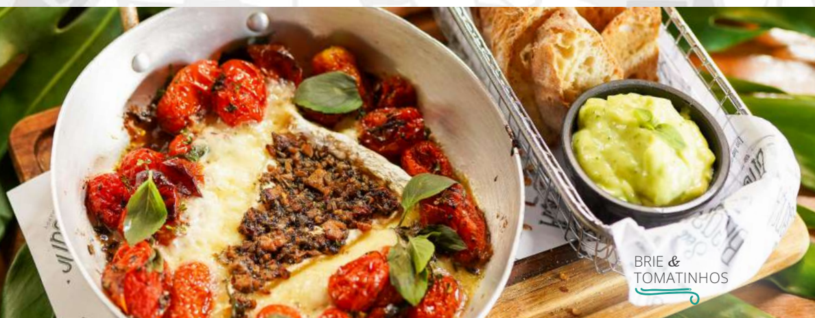
BRIE & TOMATINHOS

Tomatinhos cereja marinados em azeite de oliva com especiarias, uma fatia generosa de brie coberta com molho chimichurri de Braga, finalizado com folhas frescas de manjericão. Acompanha torradinhas de pão ciabatta.