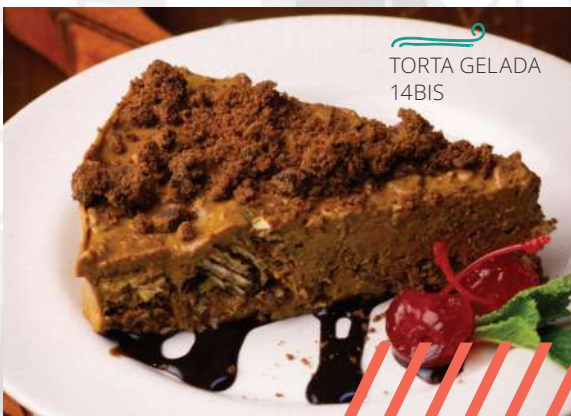
TORTA GELADA 14BIS

Torta gelada de café, Bis, chocolate meio amargo, creme de leite, doce de leite cremoso e calda de chocolate. Finalizado com cookies de chocolate, cereja e hortelã.