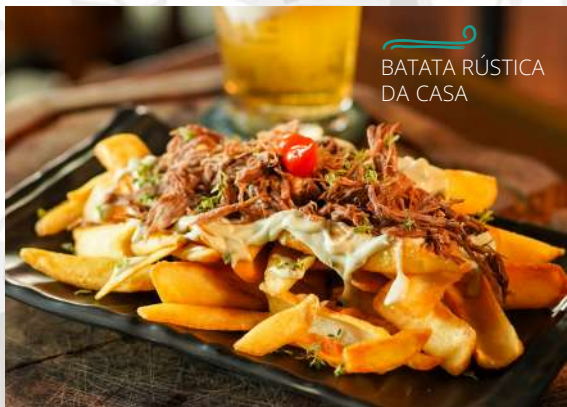
BATATA RÚSTICA DA CASA

Batata rústica frita, molho gorgonzola, finalizado com nossa deliciosa costela desfiada e tomilho fresco.