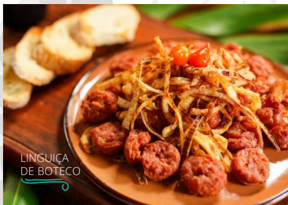
LINGUIÇA DE BOTECO

Essa vai bem com um chopp bem gelado. Linguiça toscana bem saborosa, picadinha e frita. Acompanha cebola crispy, torradinhas, molho caseiro e farofa.