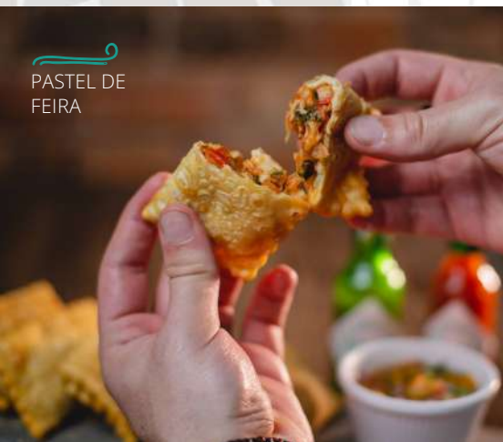
PASTEL DE FEIRA

Pastel tradicional das feiras cariocas, no sabor pizza. Leva muçarela, manjeriço, tomate picadinho e orégano. Acompanha vinagrete.