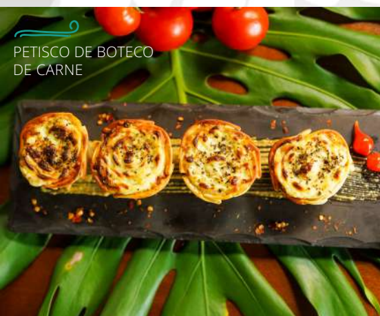
PETISCO DE BOTEÇO DE CARNE

Aquela releitura de buraco quente, um clássico de boteco, massinhas assadas e bem crocantes recheadas de carne moída, muçarela e requeijão, finalizado com orégano.