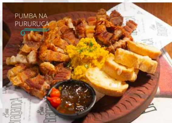
PUMBA NA PURURUCA

Carne de porco à pururuca, uma iguaria replicada em bares de todo o Brasil. A nossa delícia é panceta, curtida com especiarias, assada e frita para pururucar. Acompanha farofa, torradinha de alho, limão e geleia de pimenta.