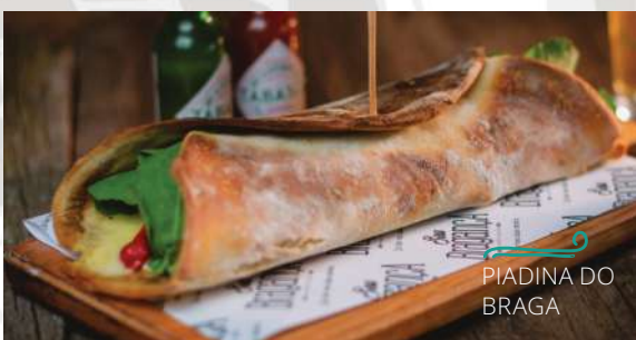
PIADINA DO BRAGA

Massa fininha tipo italiana, recheada com costela desfiada, catupiry, pimenta biquinho, muçarela e rúcula. Acompanha molho mostarda e mel.