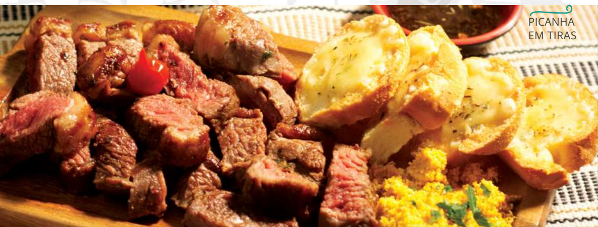
PICANHA EM TIRAS

Tiras suculentas de picanha na chapa, temperadas com sal e pimenta. Acompanha torradas de alho, farofa da casa e molho chimichurri.