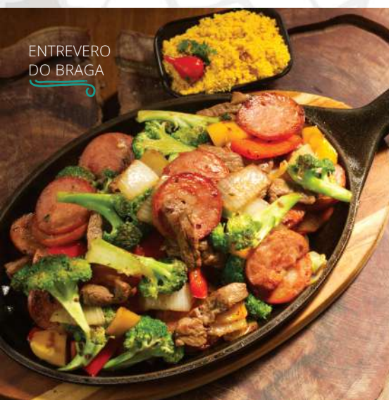
ENTREVERO DO BRAGA

Tiras de filé mignon com molho gorgonzola por cima. Acompanha farofa e torradas de alho.