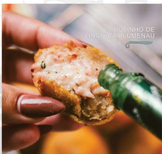
BOLINHO DE LINGUIÇA BLUMENAU

Massinha de aipim bem cremosa e temperada, e recheio de linguiça Blumenau ralada e requeijão cremoso.