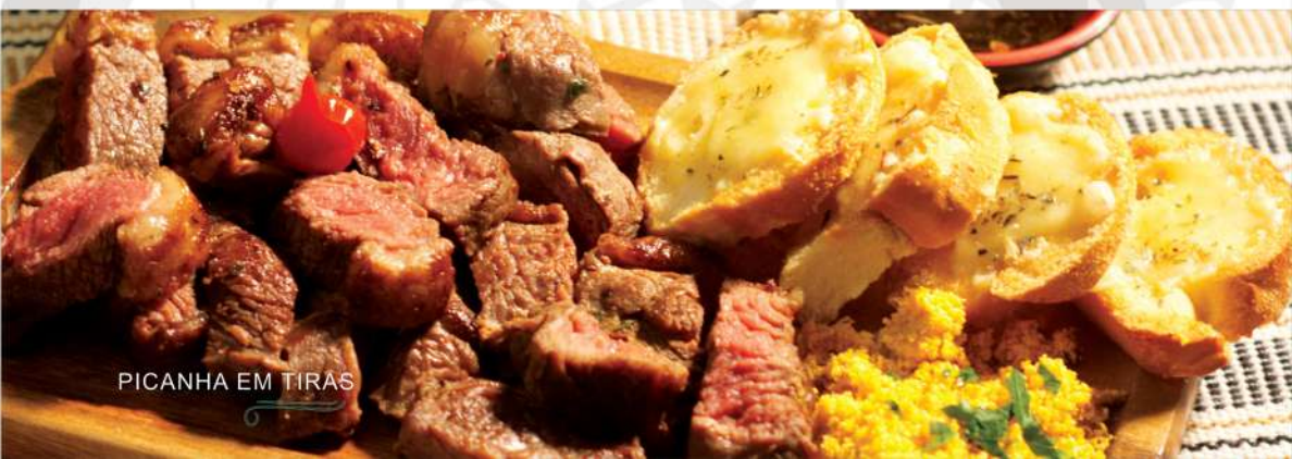
PICANHA EM TIRAS

Tiras suculentas de Picanhas na chapa, temperadas com sal e pimenta. Acompanha torradas de alho e farofa da casa e chimichurri.