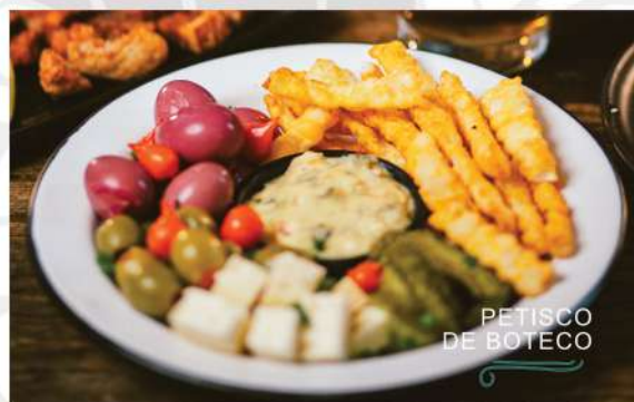
PETISCO DE BOTECO

Ovos de codorna, pickles, azeitonas, queijo serrano e casquinhas de pastel. Acompanha molho tártaro.