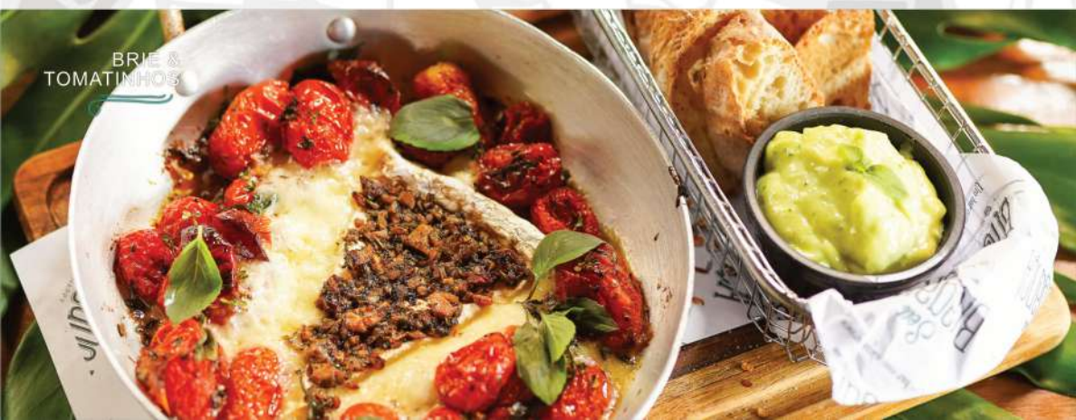
BRIE & TOMATINHOS

Tomatinhos cereja marinados em azeite de oliva com especiarias, uma fatia generosa de brie coberta com molho chimichurri do Braga, finalizado com folhas frescas de manjeriço. Acompanha torradinhas de pão ciabatta.