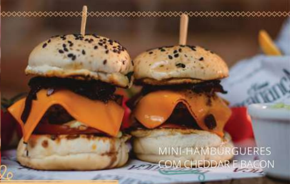
MINI-HAMBÚRGUERES COM CHEDDAR E BACON