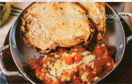
PARMEGIANA À TOSCANA