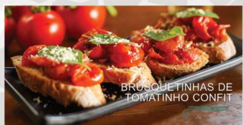
BRUSQUETINHAS DE TOMATINHO CONFIT

Deliciosas brusquetas com tomatinhos confitados, folhas de manjeriço, finalizado com provolone ralado.