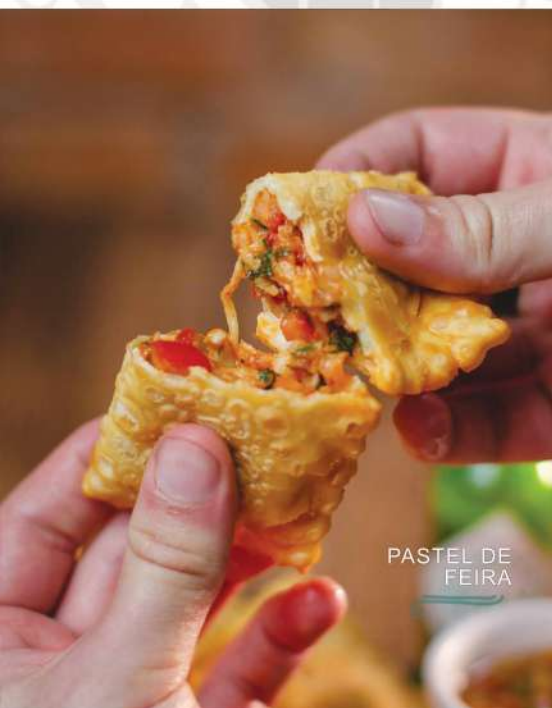
PASTEL DE FEIRA

Dadinho de tapioca com queijo coalho. Acompanha geléia de pimenta dedo de moça, ardência suave.