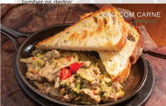
PÃO COM CARNE

Uma combinação perfeita, Pão com Carne. Mas fomos além, trazendo uma fatia grossa, generosa de pão Toscano do Pá, artesanal, acompanhado de Alcatra chapeada em tiras suculentas, a parte um molho encorpado com queijos e Brócolis para você cobrir o pão e lamber os dedos.