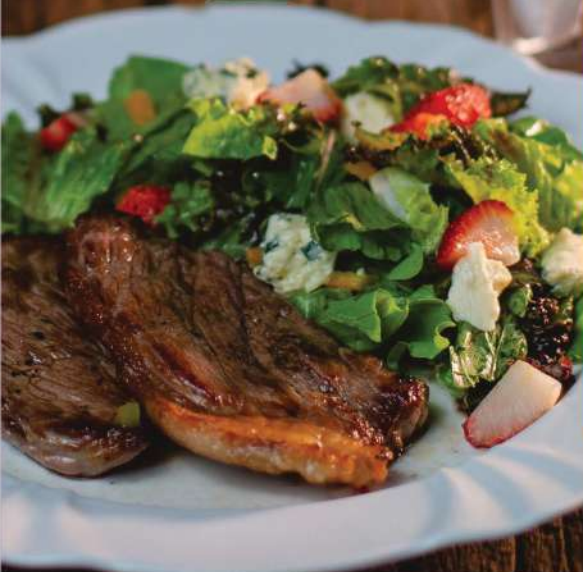
PICANHA GRELADA COM MIX DE FOLHAS VERDES