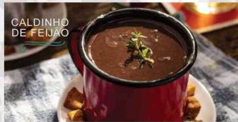
CALDINHO DE FEIJÃO

Delicioso caldinho de feijão bem temperadinho, alho, cebola, bacon e calabresa. Finalizado com salsinha e torresmo.