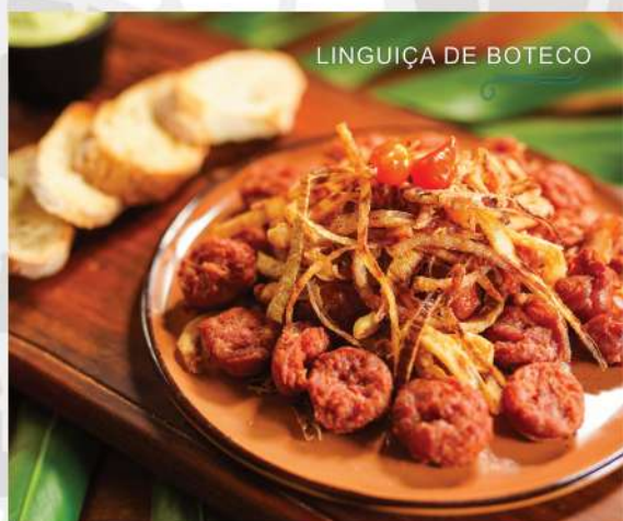
LINGUIÇA DE BOTECO

Essa vai bem com um chopp bem gelado. Linguiça toscana bem saborosa, picadinha e frita. Acompanha cebola crispy, torradinhas, molho caseiro e farofa.