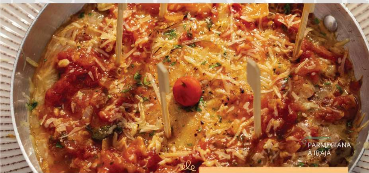
PARMEGIANA À IRAJÁ

Duas fatias de picanha grelhada, mix de folhas verdes, pimentão amarelo picadinho, gorgonzola, morango e nozes. Acompanha molho Chimichurri.