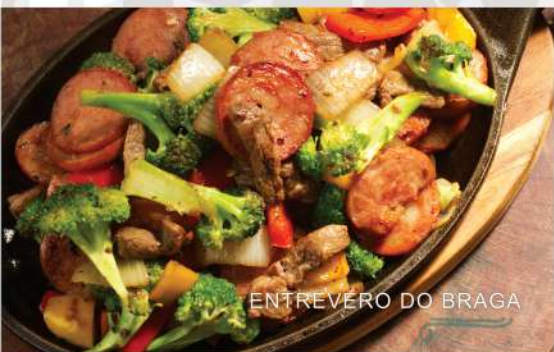
ENTREVERO DO BRAGA

Tiras de tilápia à milanesa. Acompanha limão e molho tártaro.