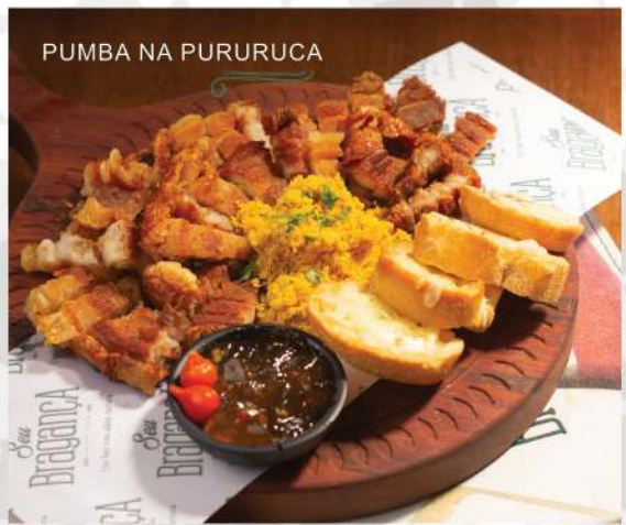
PUMBA NA PURURUCA

Carne de Porco à Pururuca, uma iguaria replicada em bares de todo o Brasil. A nossa delícia é panceta, curtida com especiarias, assada e frita para pururucar. Acompanha farofa, torradinha de alho, limão e geleia de pimenta.