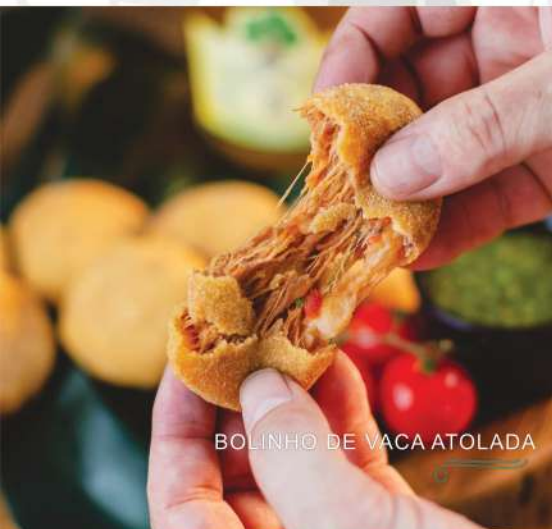
BOLINHO DE VACA ATOLADA

Acompanha molho caseiro. Solicite ao garçom adicional de bacon, cheddar ou mussarela se desejar.