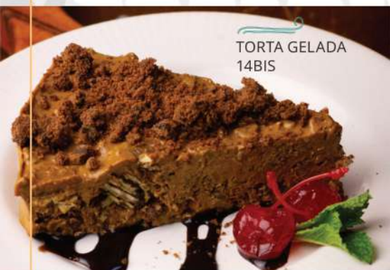
TORTA GELADA 14BIS