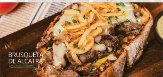
BRUSQUETA DE ALCATRA

Pão toscano, alcatra em tiras, queijo muçarela, molho Bragança e cebola crispy.